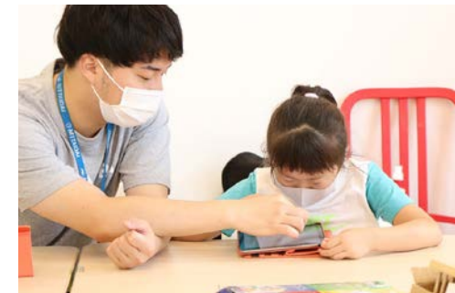
「公益社団法人 ハタチ基金」 被災地の子どもたちに学び・自立の機会を 提供する活動に寄付

また、今年度はウクライナへの緊急支援活動に賛同し、社員募金に会社からの拠出を加え、マッチングギフトとして寄付を行いました。