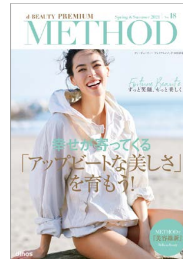
カタログ「d-BEAUTY PREMIUM METHOD ディービューティー プレミアムメソッド」

日本にとって大きな課題とされる「多様性」。当社でも重点領域のひとつとして様々な取組みを行っています。女性特有の心身の悩みに寄り添う商品とそれに伴う様々な情報発信のほか、年齢を重ねた日常をサポートする商品や、家事負担を軽減し、“時短”“時産”に貢献するアイテムなどを幅広く展開しました。また、「D&I」への理解を深める社内研修やオフィスのフリーアドレス化を進めるなど、多様な働き方を推進しています。