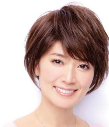
髪のパリウムダウンの悩みを解決。 自分流のおしゃれを楽しめるウィッグ

当社では、年齢を重ねていくことにとらわれず、様々な身体上や日常生活の課題を、前向きにおしゃれに解決する、様々なアイテムを提案していきます。