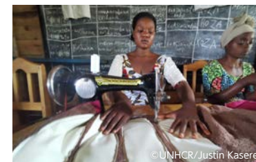
「国連UNHCR協会」 難民・避難民の女性たちの生理用品へのアクセスを改善し、 自立を促進する活動に寄付