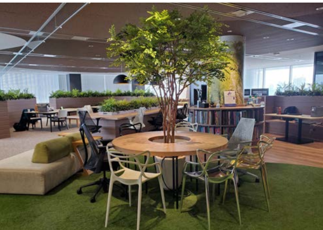
自由で快適なフリーアドレスオフィス

これらの点が評価され、任意団体「work with Pride」によるLGBTQ+への取組み評価「PRIDE」指標において「シルバー」を、D&Iに取組む企業を認定する「D&I アワード」では「Advanced」認定をそれぞれ取得しました。