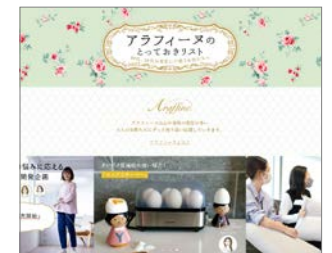
webコンテンツ 「アラフィフのとおきリスト」